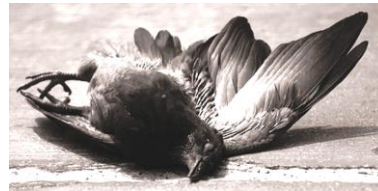
Abb. 2: Seth Godins Folie zur Luftverschmutzung in Houston, Texas.

Der amerikanische Autor Seth Godin empfiehlt für Bildfolien das Folgende: Die visuellen Folien sollten die gesprochenen Inhalte verstärken und nicht wiederholen. Dazu sollte man am besten mit emotionalen Bildern arbeiten. Ein Beispiel dazu. Um auf die Luftverschmutzung in Houston, Texas, aufmerksam zu machen, ist nach es Godin wirkungsvoller, eine Folie mit dem Bild eines toten Vogels zu zeigen (siehe Abb. 2) und die statistischen Zahlen zur Luftverschmutzung mündlich dazu wieder zu geben, als eine trockene Textfolie mit den statistischen Zahlen vorzulesen. (Godin, 2007)